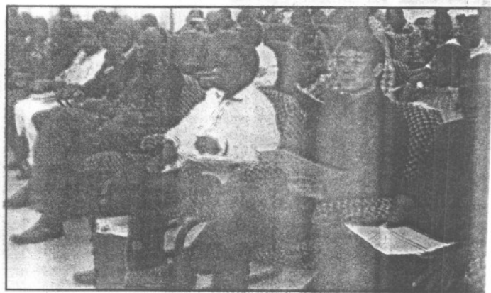
... et ont fait des suggestions pour l'élaboration du plan décennal de développement durable