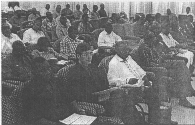
Ils sont venus de divers horizons pour des échanges fructueux autour des MCPD

Pour la mise en œuvre des conventions de la génération de Rio, le Burkina Faso a pris des engagements pour contribuer à réaliser à l'échelle mondiale le développement durable. Parmi ceux-ci, il y a l'initiative concernant les modes de consommation et de production durables (MCPD). Un atelier sur la question s'est ouvert le lundi 19 avril 2010 à Ouagadougou.