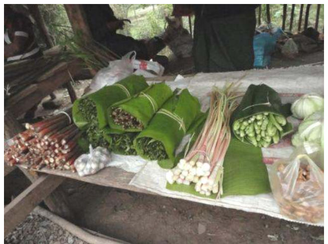
ຮູບທີ 1: ເຄື່ອງປ່າຂອງດົງທີ່ວາງຂາຍຢູ່ຕະຫຼາດທ້ອງຖິ່ນ

ຈຸດປະສົງຂອງໂຄງການ ແມ່ນເພື່ອສະໜັບສະໜູນຄວາມຄືບໜ້າໃນການກ້າວໄປສູ່ການຫຼຸດຜ່ອນຄວາມທຸກຍາກ ໂດຍຜ່ານການເຊື່ອມໂຍງເອົາບັນຫາສິ່ງແວດລ້ອມເຂົ້າໃນການວາງ ແລະ ຈັດຕັ້ງປະຕິບັດແຜນພັດທະນາເສດຖະກິດ-ສັງຄົມແຫ່ງຊາດ. ໂດຍສະເພາະ, ກໍລະນີສຶກສານີ້ຈະໃຫ້ຂໍ້ມູນຂ່າວສານທີ່ດີຂຶ້ນ ກ່ຽວກັບ ການເຊື່ອມໂຍງການບໍລິການລະບົບນິເວດຂອງການນຳໃຊ້ທີ່ດິນທີ່ແຕກຕ່າງກັນ ແລະ ການປະກອບສ່ວນຂອງພວກມັນຕໍ່ກັບຊີວິດການເປັນຢູ່ ແລະ ການດຳລົງຊີວິດທີ່ດີຂອງຜູ້ທີ່ທຸກຍາກຢູ່ໃນເຂດຊົນນະບົດ.