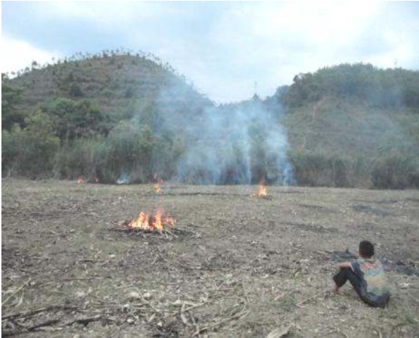
ຮູບທີ 3: ການກຽມດິນເພື່ອການປູກພືດເສດຖະກິດ