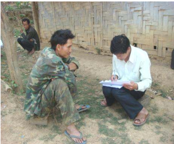
ຮູບທີ 4: ພະນັກງານຈາກພະແນກແຜນການ ແລະ ການລົງທຶນຂອງແຂວງອຸດົມໄຊປະກອບສ່ວນລົງເກັບກຳຂໍ້ມູນ