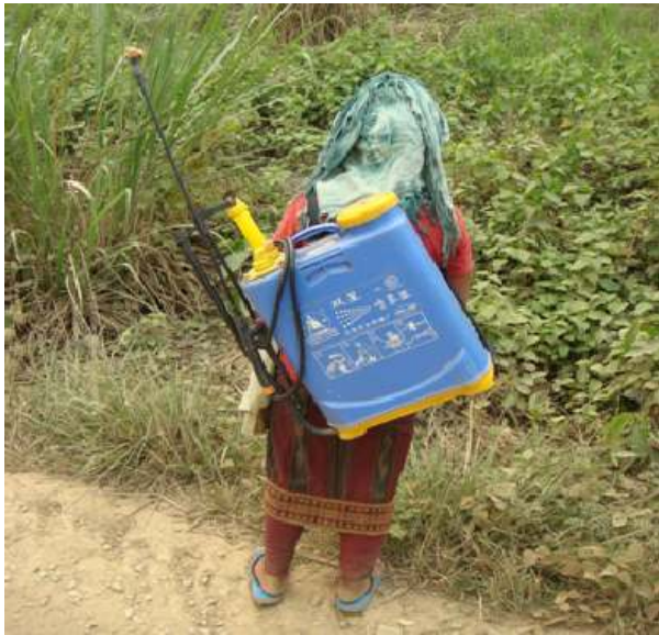
ຮູບທີ 2: ການນໍາໃຊ້ຢາຂ້າຫຍ້າໂດຍຄົນທ້ອງຖິ່ນ

ໝາຍຄວາມວ່າ ການວິໄຈທາງເສດຖະກິດແມ່ນເປັນທີ່ຈະແຈ້ງແລ້ວວ່າ: ຢາງພາລາແມ່ນທາງເລືອກຂອງການນໍາໃຊ້ທີ່ດິນທີ່ໃຫ້ຜົນປະໂຫຍດສູງສຸດຂອງທັງສີ່ລະບົບການນໍາໃຊ້ທີ່ດິນທີ່ໄດ້ຮັບການສຶກສາໃນເທື່ອນີ້. ເຖິງແນວໃດກໍ່ຕາມ, ທັງການປູກສາລີ ແລະ ຢາງພາລາກໍ່ບໍ່ຈຳເປັນຕ້ອງແມ່ນທາງເລືອກຂອງການນໍາໃຊ້ທີ່ດິນທີ່ດີສະເໝີໄປ ສໍາລັບການດຳລົງຊີວິດທີ່ຍືນຍົງຂອງບັນດາຄົວເຮືອນຊົນນະບົດຢູ່ໃນໄລຍະຍາວ ໂດຍປັດສະຈາກການປັບປຸງວິທີການຈັດຕັ້ງປະຕິບັດຕົວຈິງທີ່ດີຂຶ້ນ. ການວິໄຈທາງເສດຖະກິດນີ້ ແມ່ນຍັງບໍ່ທັນໄດ້ລວມເອົາຜົນກະທົບຕໍ່ສະພາບແວດລ້ອມທີ່ກຳນົດເປັນຕົວເຖິງບໍ່ໄດ້ ຕໍ່ກັບບ້ານທີ່ຕັ້ງຢູ່ເຂດລຸ່ມນໍ້າເຂົ້ານໍາ (ດັ່ງທີ່ສະເໜີໄວ້ໃນຕາຕະລາງທີ 2). ຖ້າຫາກມີການປະເມີນຄ່າຜົນຕາມມາຂອງການບໍລິການລະບົບນິເວດ ແລະ ຜົນກະທົບຈາກພາຍນອກເຂົ້ານໍາຢ່າງເຕັມສ່ວນແລ້ວ, ຜົນຕອບແທນຂອງການປູກສາລີ ແລະ ຢາງພາລາກໍ່ອາດຈະຕໍ່າລົງກວ່ານີ້ຫຼາຍ.