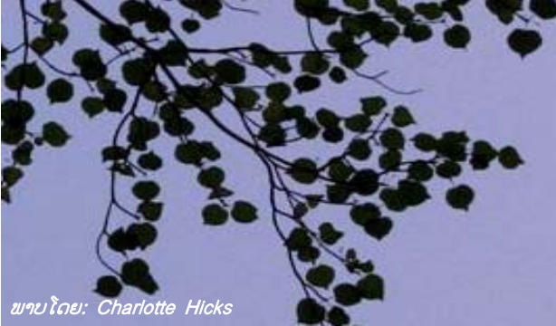
ພາບໂດຍ: Charlotte Hicks